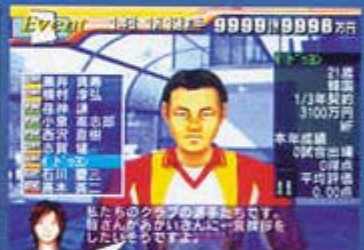
역시 일본판 <프로 축구클럽을 만들지>. 저 정도 돈이 있어도 한 10년 운영하면 적자가 나 버리니 원...