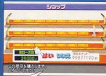
일본판 <오두의 골프3>. 역시 프로는 돈이야. 돈 우허허하하!!