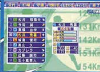
역시 <프로야구팀을 만들지2>, 첫해부터 마츠이와 후루타라는, 돈으로 도배를 해야하는 FA선수들을 영입할 수 있다. 역시 프로는 돈이야...