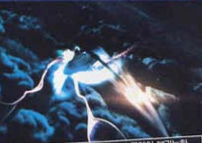
역시 코드 2번이라 정말 PS2에선 플레이 불가능한 일본영화 <기동전사-시신 각성>의 한 장면. 영화나 애니메이션 렌더링만 보면 코드 프리 DVD플레이어 없을 실 필요 없애지게 만드는 장면이다