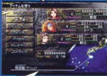
<파이널 판타지 X-2>의 AR 화면을 잘 보면 참...