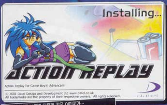
동봉된 CD를 넣으면 다음과 같은 이미지가...

GBA용 AR의 가장 큰 장점은 세이브 데이터를 저장할 수 있다는 점이다. 간혹 카트리지의 배터리가 전량 소진 될 경우, 세이브 데이터를 날리는 것은 너무나도 아까운 일이다. 이런 경우 AR을 이용하여 데이터를 백업 해두면 차후에 복원이 가능하다. 물론 세이브 데이터는 종류에 따라 1분~3분 정도의 전송시간을 필요로 한다 (USB 1.1까지만 지원). 여러 PC에서 테스트를 해 본 결과 국내에서 주로 사용되는 PC에서는 그 속도가 상대적으로 느렸으며, DELL같은 복미에서 주로 생산되는 PC에서는 50%정도의 속도 상승 효과를 얻을 수 있다.