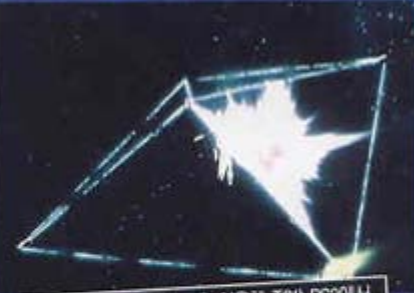
이것은 코드 프리 기능을 이용해 정말 PS2에서 돌려 본 일본판 <기동전사 건담 역습의 시야>의 한 장면

하지만 필자같이 PS2를 단지 게임 플레이만이 아닌 부분에서도 활용하는 사람들에게 있어서 액플은 반드시 가지고 있어야 할 기기라는 점은 변함이 없을 것이다. 그것은 바로 DVD영화 타이틀의 국가코드 해제 기능인데, 사실 필자 같은 입장에서는 한국 영화뿐만이 아니라 일본의 애니메이션, 미국의 영화나 음반등을 감상하기 위해서 코드 프리가 된 DVD 플레이어의 존재는 필수. 하지만 정식 발매된 PS2에서 어디 그런 게 가능하겠는가 말이다. 하지만 액플이 있다면 그런 걱정은 전혀 할 필요가 없다. 애니메이션을 좋아하는 필자에게 정말 눈물나도록 감사한 기능이 아닐 수 없는 것이다.