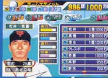
일본판 <프로야구팀을 만들지2>의 사진. 게임 개시부터 999억엔을 쓸 수 있기 때문에 원하는 선수는 누구라도 팀에 전편시킬 수 있다

현재 공개되어 있는 액플 코드의 수는... 뭐 간단하게 1000은 넘어갈 정도일텐데, 그 많은 작품들을 모두 소개하기에는 지면의 양이 너무 한정되어 있기 때문에, 여기서는 그럭저럭 인기 있는 타이틀 중 몇 가지를 골라 실험을 해 본 사진을 올리겠다.