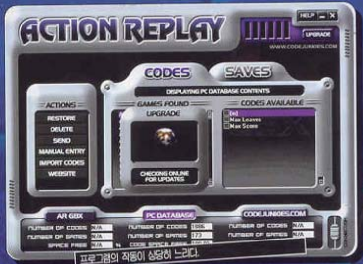
프로그램의 작동이 상당히 느리다.