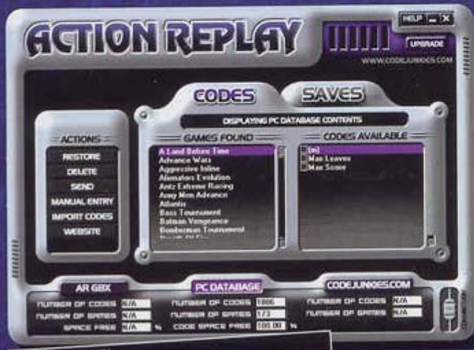
프로그램 기본 화면