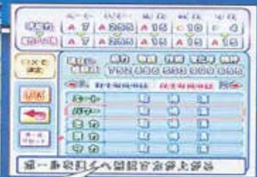
일본판 <심함 파워볼 프로야구9> 통상적인 플레이로는 이런 능력치는 절대 볼 수 없지